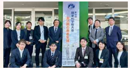
▲ 列島会の皆様とむすびメンバーにて